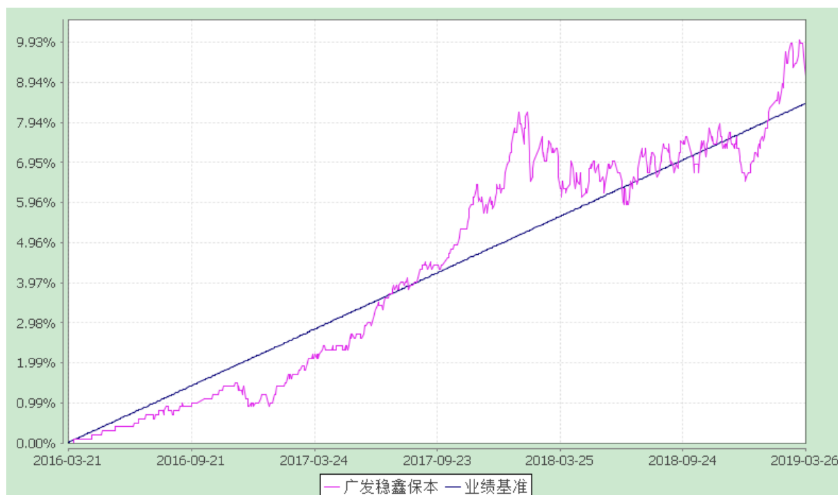
自基金合同生效日以来份额累计净值增长率与业绩比较基准收益率的历史走势对比图 (2016 年 3 月 21 日至 2019 年 3 月 26 日)