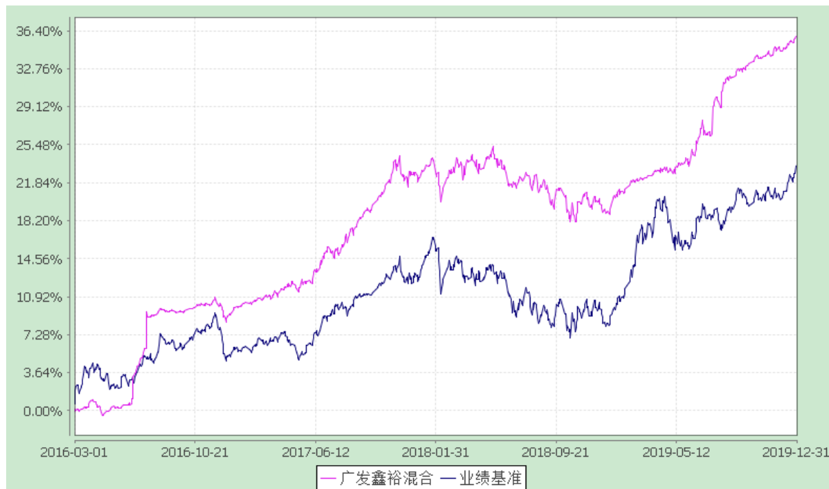
广发鑫裕灵活配置混合型证券投资基金 份额累计净值增长率与业绩比较基准收益率的历史走势对比图 (2016年3月1日至2019年12月31日)