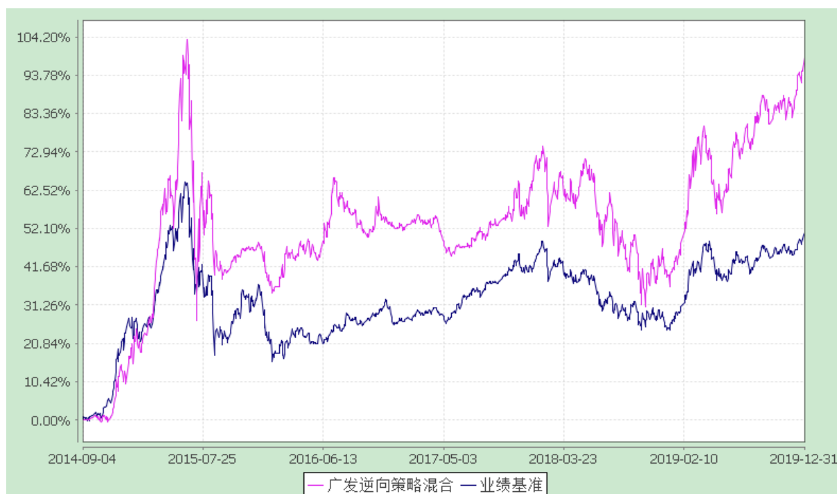
广发逆向策略灵活配置混合型证券投资基金 份额累计净值增长率与业绩比较基准收益率的历史走势对比图 (2014 年 9 月 4 日至 2019 年 12 月 31 日)