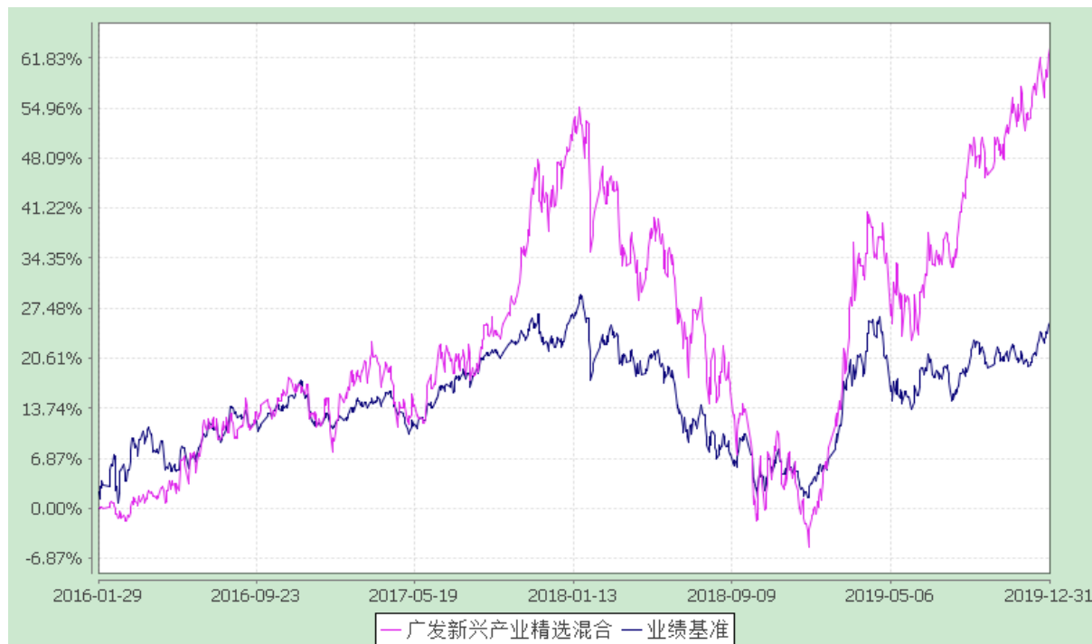
广发新兴产业精选灵活配置混合型证券投资基金 份额累计净值增长率与业绩比较基准收益率的历史走势对比图 (2016 年 1 月 29 日至 2019 年 12 月 31 日)