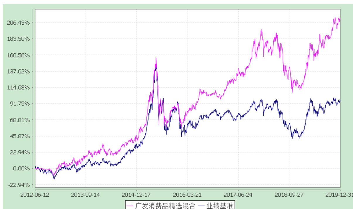
广发消费品精选混合型证券投资基金 份额累计净值增长率与业绩比较基准收益率的历史走势对比图 (2012 年 6 月 12 日至 2019 年 12 月 31 日)