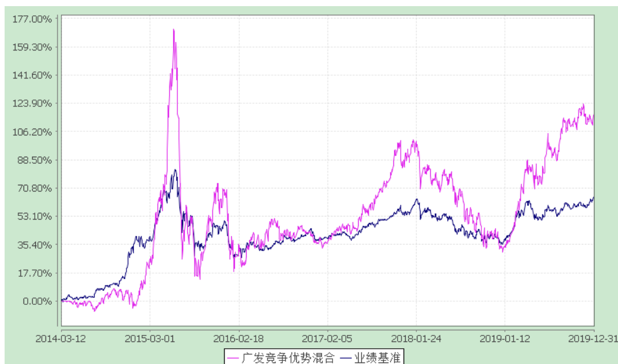
广发竞争优势灵活配置混合型证券投资基金 份额累计净值增长率与业绩比较基准收益率的历史走势对比图 (2014 年 3 月 12 日至 2019 年 12 月 31 日)