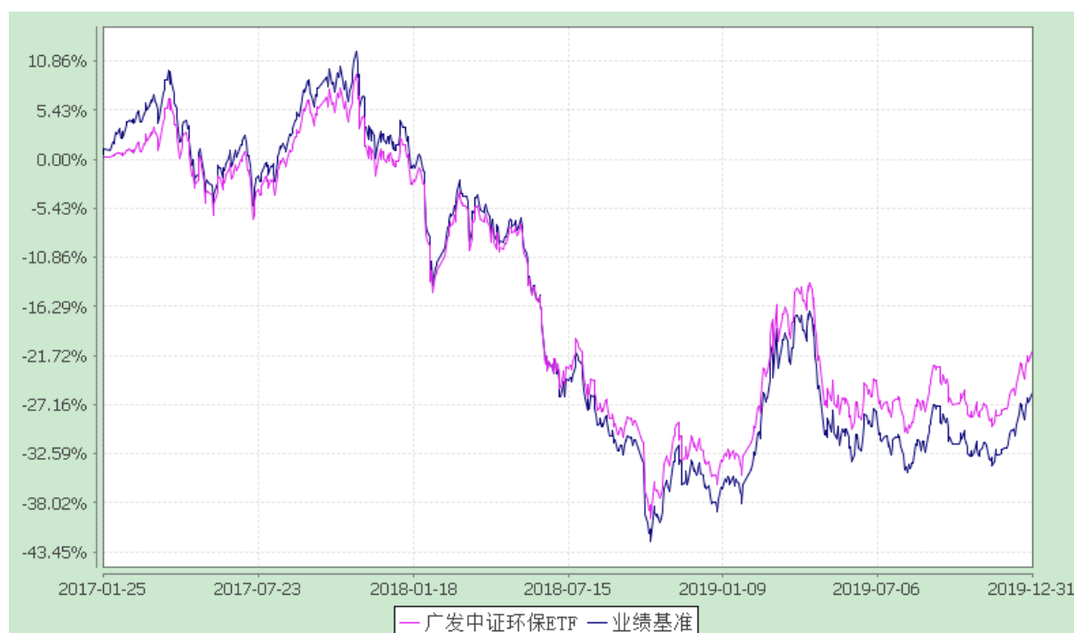
广发中证环保产业交易型开放式指数证券投资基金 份额累计净值增长率与业绩比较基准收益率的历史走势对比图 (2017 年 1 月 25 日至 2019 年 12 月 31 日)