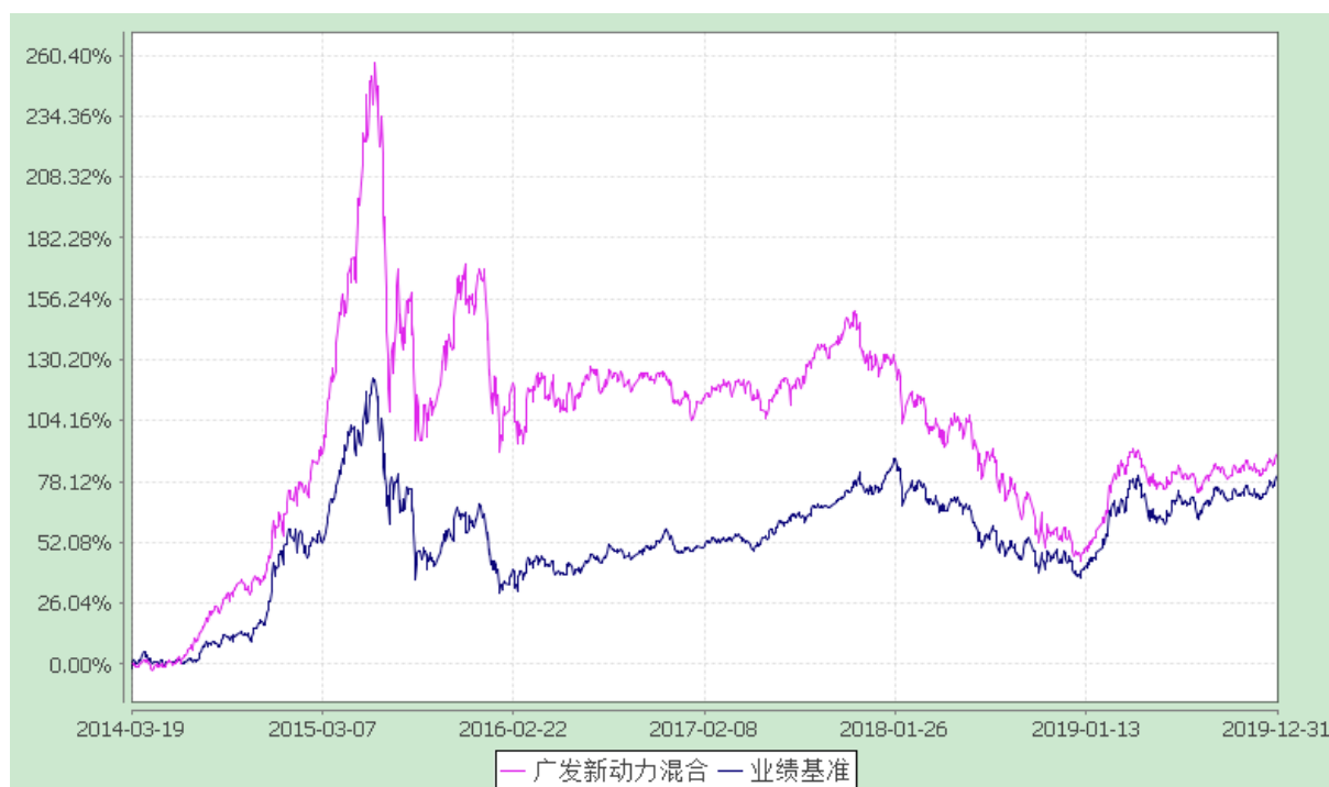
广发新动力混合型证券投资基金 份额累计净值增长率与业绩比较基准收益率的历史走势对比图 (2014 年 3 月 19 日至 2019 年 12 月 31 日)