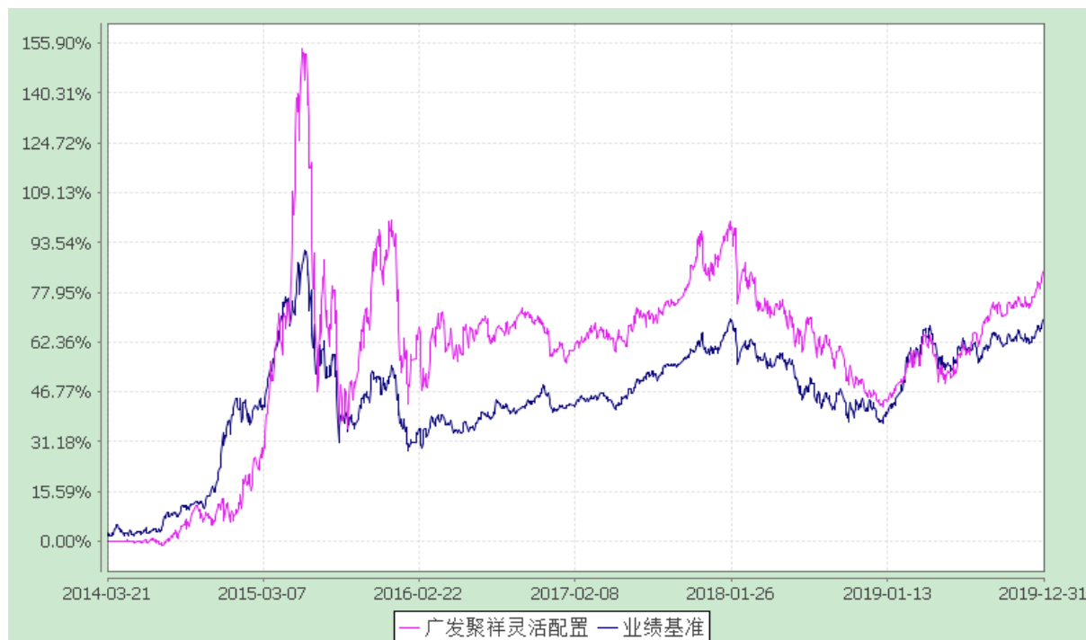
份额累计净值增长率与业绩比较基准收益率的历史走势对比图 (2014 年 3 月 21 日至 2019 年 12 月 31 日)