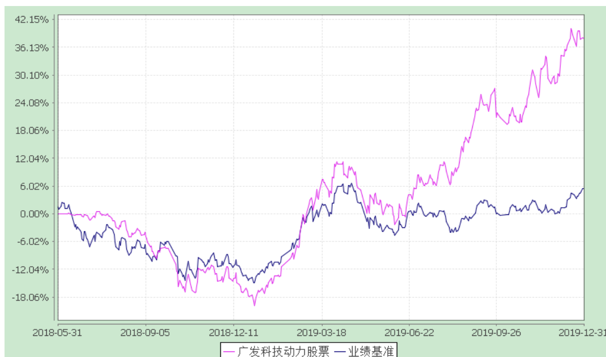
广发科技动力股票型证券投资基金 份额累计净值增长率与业绩比较基准收益率的历史走势对比图 (2018年5月31日至2019年12月31日)