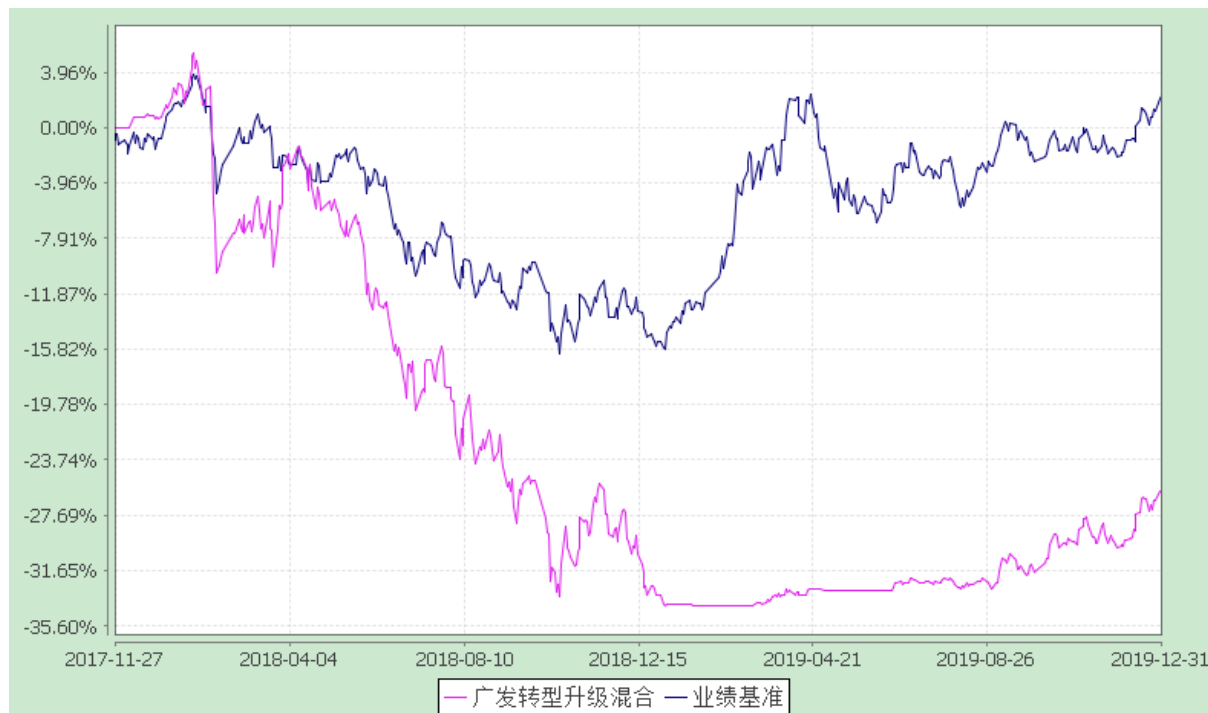
广发转型升级灵活配置混合型证券投资基金 份额累计净值增长率与业绩比较基准收益率的历史走势对比图 (2017 年 11 月 27 日至 2019 年 12 月 31 日)