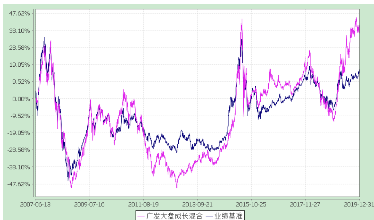
广发大盘成长混合型证券投资基金 份额累计净值增长率与业绩比较基准收益率的历史走势对比图 (2007 年 6 月 13 日至 2019 年 12 月 31 日)