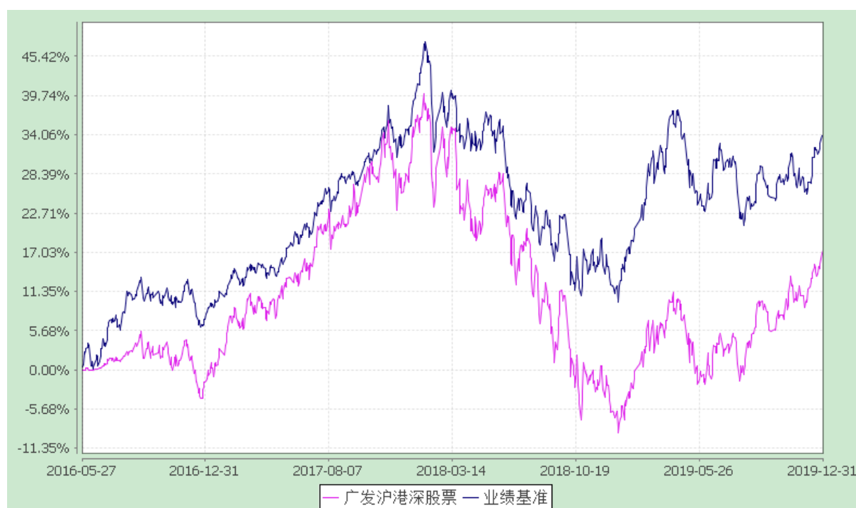
广发沪港深新机遇股票型证券投资基金 份额累计净值增长率与业绩比较基准收益率的历史走势对比图 (2016 年 5 月 27 日至 2019 年 12 月 31 日)