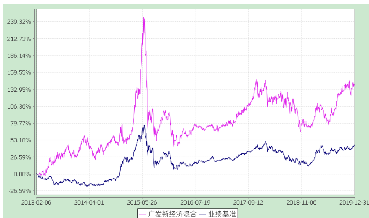
广发新经济混合型发起式证券投资基金 份额累计净值增长率与业绩比较基准收益率的历史走势对比图 (2013 年 2 月 6 日至 2019 年 12 月 31 日)