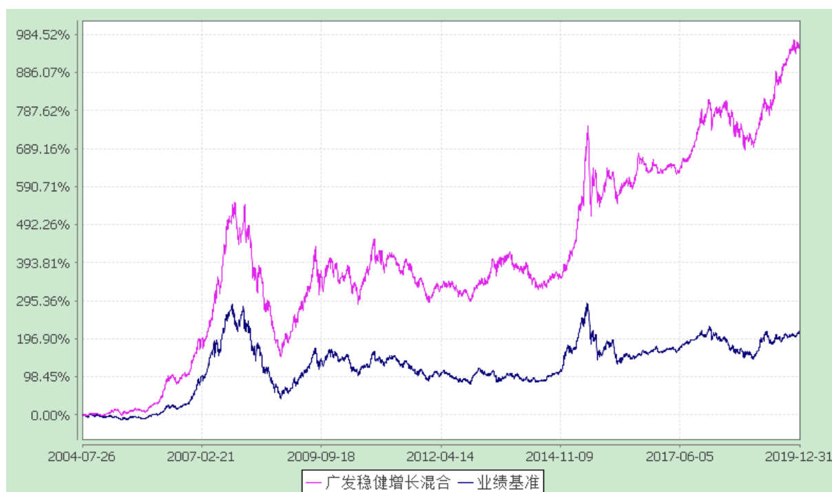
广发稳健增长开放式证券投资基金 份额累计净值增长率与业绩比较基准收益率的历史走势对比图 (2004 年 7 月 26 日至 2019 年 12 月 31 日)

注：自 2015 年 11 月 2 日起，本基金的业绩比较基准由原“中信标普 300 指数收益率×65%+中信标普国债指数收益率×35%”变更为“沪深 300 指数收益率×65%+中证全债指数收益率×35%”。