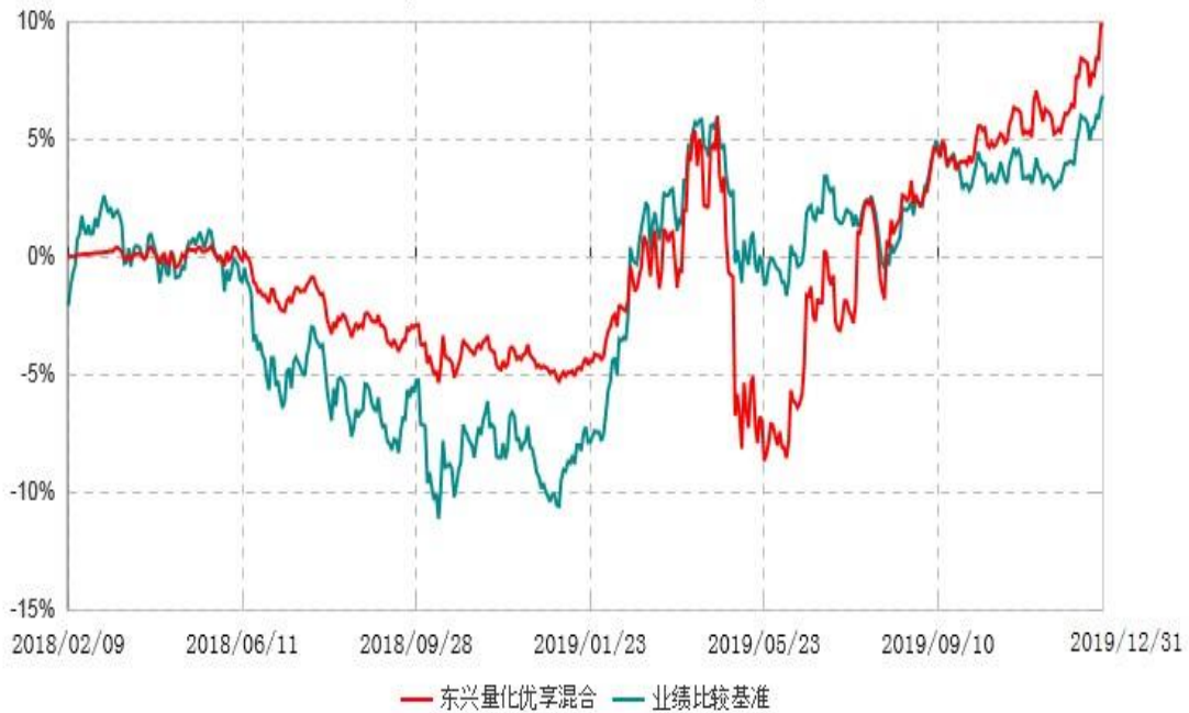
东兴量化优享灵活配置混合型证券投资基金累计净值增长率与业绩比较基准收益率历史走势对比图 (2018年02月09日-2019年12月31日)

注：1、本基金基金合同生效日为2018年2月9日，根据相关法律法规和基金合同，本基金建仓期为基金合同生效之日起6个月内； 2、建仓期结束时各项资产配置比例符合合同约定。