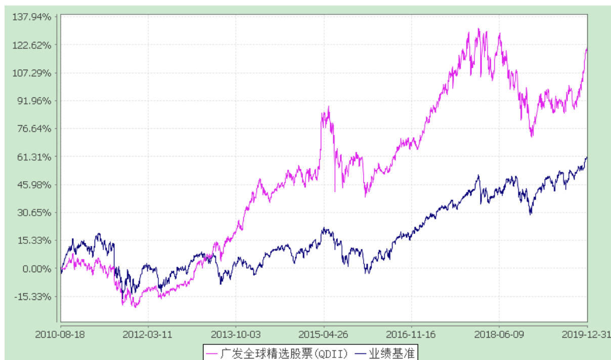
广发全球精选股票型证券投资基金 份额累计净值增长率与业绩比较基准收益率历史走势对比图 (2010 年 8 月 18 日至 2019 年 12 月 31 日)

注：本基金自 2014 年 6 月 10 日起，将基金业绩比较基准由“摩根士丹利综合亚太（除日本）总收益指数”变更为“60%×MSCI 全球指数（MSCI World Index）+40%×恒生指数”。