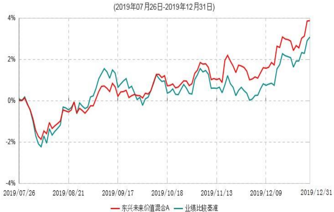
东兴未来价值混合A累计净值增长率与业绩比较基准收益率历史走势对比图