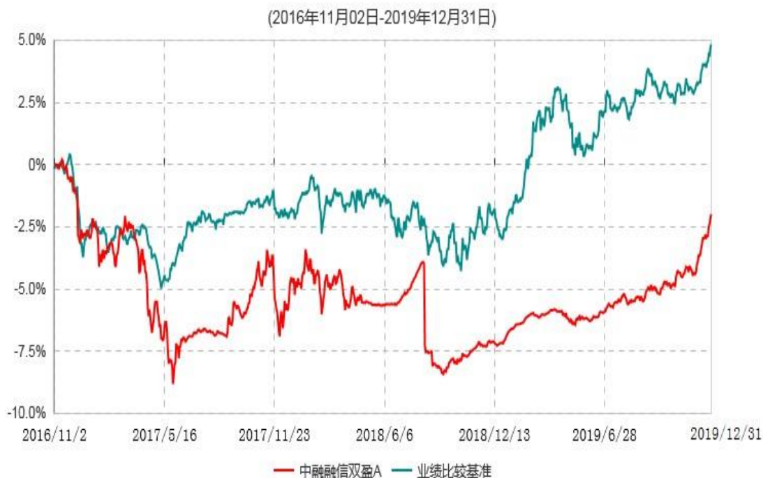
中融融信双盈C累计净值增长率与业绩比较基准收益率历史走势对比图