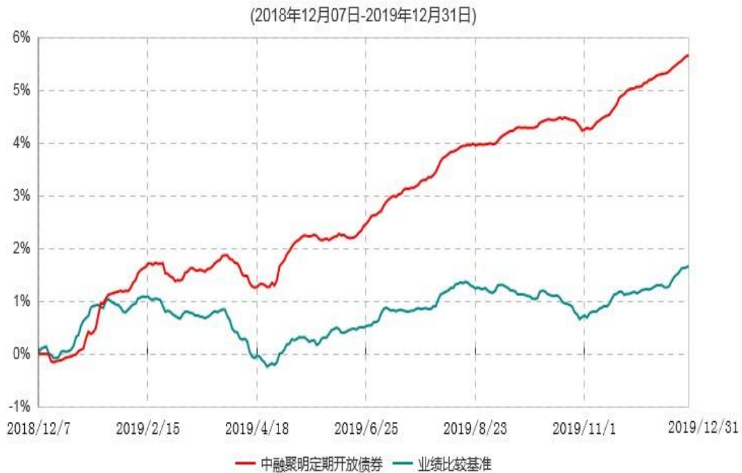
中融聚明3个月定期开放债券型发起式证券投资基金累计净值增长率与业绩比较基准收益率历史走势对比图

注：按基金合同和招募说明书的约定，本基金自基金合同生效日起6个月内为建仓期，建仓期结束时本基金的各项投资比例符合基金合同的有关约定。