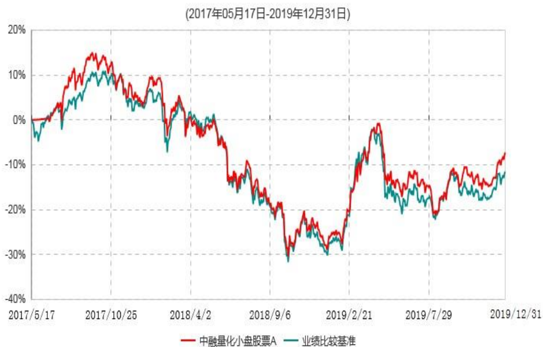
中融量化小盘股票A累计净值增长率与业绩比较基准收益率历史走势对比图