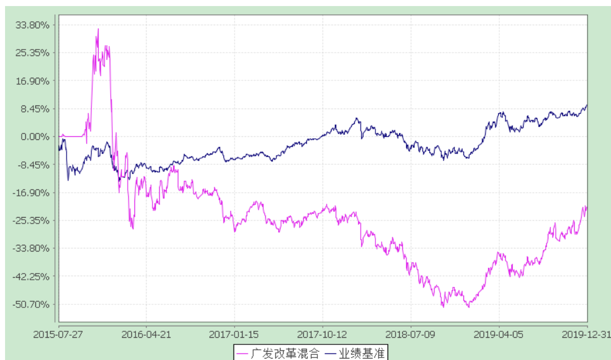
广发改革先锋灵活配置混合型证券投资基金 份额累计净值增长率与业绩比较基准收益率的历史走势对比图 (2015 年 7 月 27 日至 2019 年 12 月 31 日)