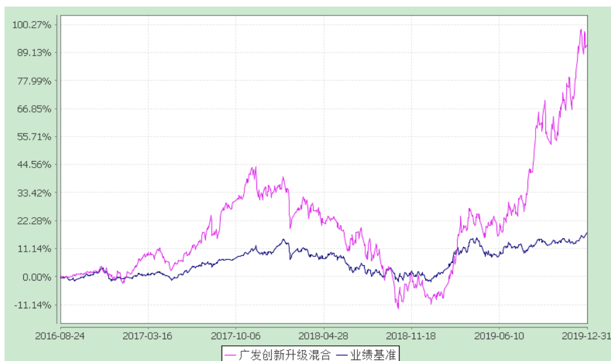
广发创新升级灵活配置混合型证券投资基金 份额累计净值增长率与业绩比较基准收益率的历史走势对比图 (2016 年 8 月 24 日至 2019 年 12 月 31 日)