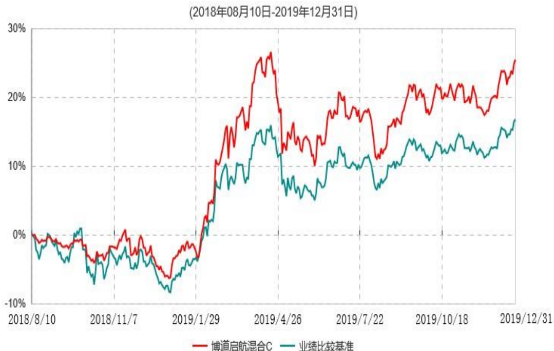
博道启航混合C累计净值增长率与业绩比较基准收益率历史走势对比图

注：本基金基金合同生效日为 2018 年 8 月 10 日，截至报告期期末，本基金已完成建仓但报告期期末距建仓结束未满一年。本基金建仓期为自基金合同生效日起的 6 个月。截至建仓期结束，本基金各项资产配置比例符合基金合同及招募说明书有关投资比例的约定。