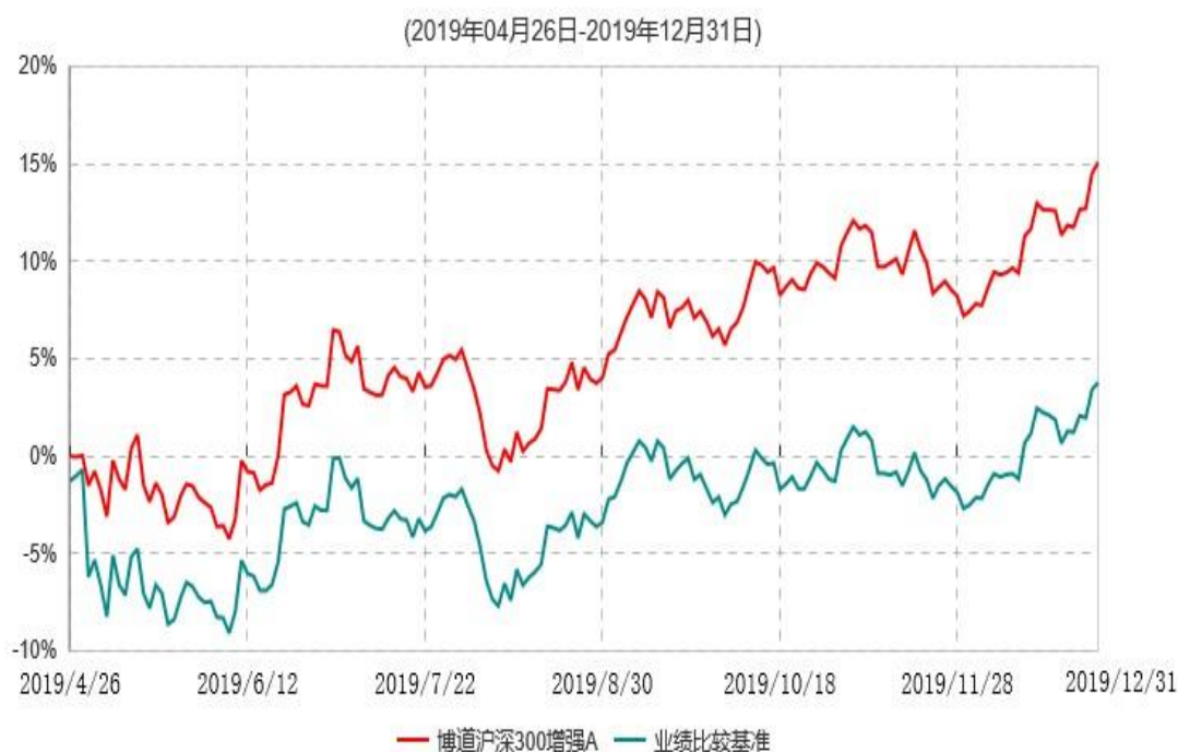
博道沪深300增强A累计净值增长率与业绩比较基准收益率历史走势对比图

注：本基金基金合同生效日为 2019 年 4 月 26 日，基金合同生效日至报告期期末，本基金运作时间未满一年。本基金建仓期为自基金合同生效日起的 6 个月。截至建仓期结束，本基金各项资产配置比例符合基金合同及招募说明书有关投资比例的约定。