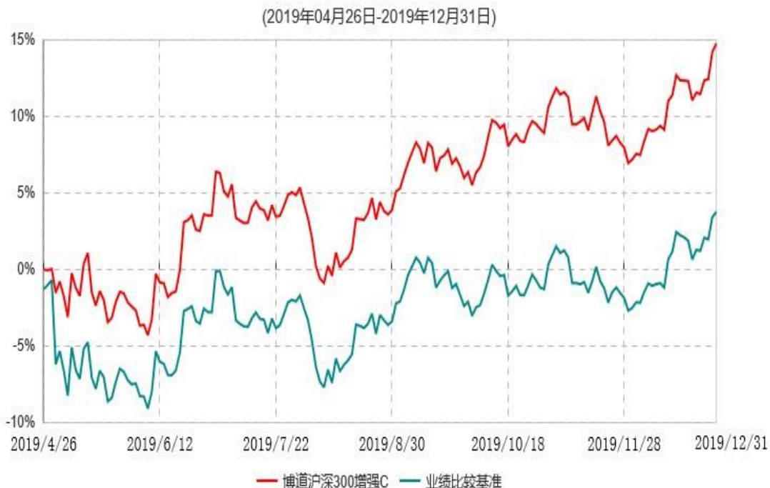
博道沪深300增强C累计净值增长率与业绩比较基准收益率历史走势对比图

注：本基金基金合同生效日为 2019 年 4 月 26 日，基金合同生效日至报告期期末，本基金运作时间未满一年。本基金建仓期为自基金合同生效日起的 6 个月。截至建仓期结束，本基金各项资产配置比例符合基金合同及招募说明书有关投资比例的约定。