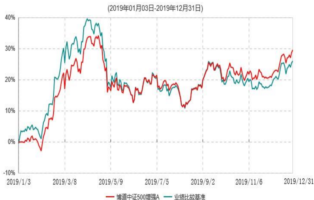
博道中证500增强A累计净值增长率与业绩比较基准收益率历史走势对比图

注：本基金基金合同生效日为 2019 年 1 月 3 日，基金合同生效日至报告期期末，本基金运作时间未满一年。本基金建仓期为自基金合同生效日起的 6 个月。截至建仓期结束，本基金各项资产配置比例符合基金合同及招募说明书有关投资比例的约定。