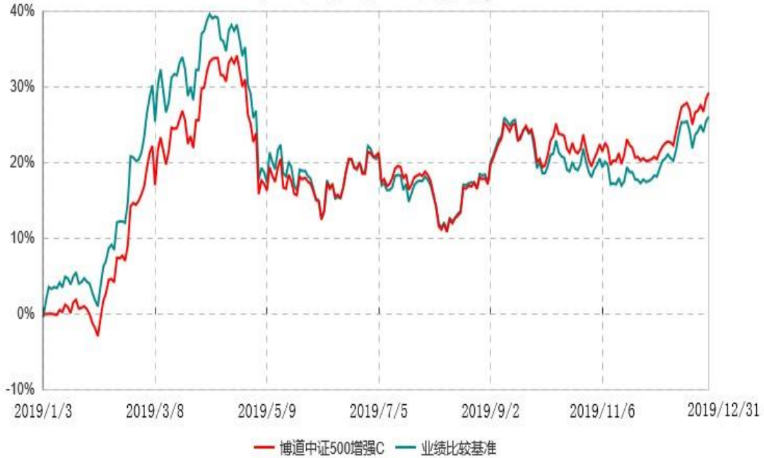
博道中证500增强C累计净值增长率与业绩比较基准收益率历史走势对比图 (2019年01月03日-2019年12月31日)

注：本基金基金合同生效日为 2019 年 1 月 3 日，基金合同生效日至报告期期末，本基金运作时间未满一年。本基金建仓期为自基金合同生效日起的 6 个月。截至建仓期结束，本基金各项资产配置比例符合基金合同及招募说明书有关投资比例的约定。