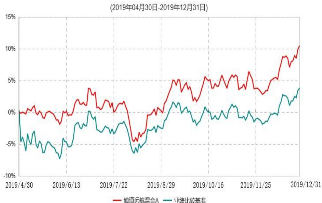
博道远航混合A累计净值增长率与业绩比较基准收益率历史走势对比图

注：本基金基金合同生效日为2019年4月30日，基金合同生效日至报告期期末，本基金运作时间未满一年。本基金建仓期为自基金合同生效日起的6个月。截至建仓期结束，本基金各项资产配置比例符合基金合同及招募说明书有关投资比例的约定。