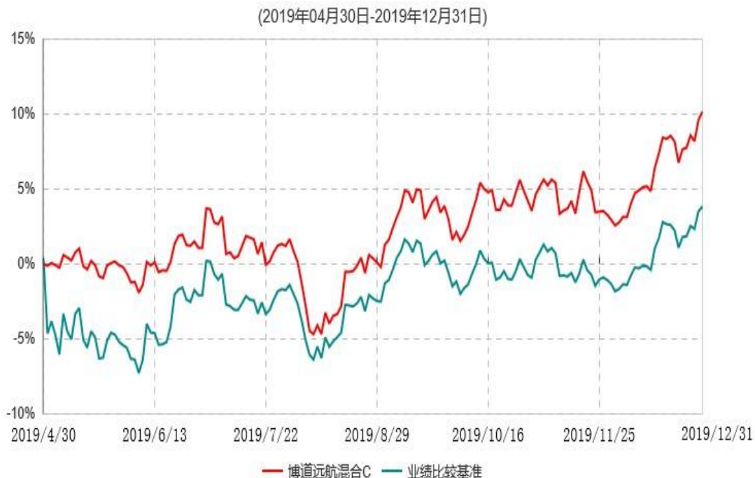
博道远航混合C累计净值增长率与业绩比较基准收益率历史走势对比图

注：本基金基金合同生效日为 2019 年 4 月 30 日，基金合同生效日至报告期期末，本基金运作时间未满一年。本基金建仓期为自基金合同生效日起的 6 个月。截至建仓期结束，本基金各项资产配置比例符合基金合同及招募说明书有关投资比例的约定。