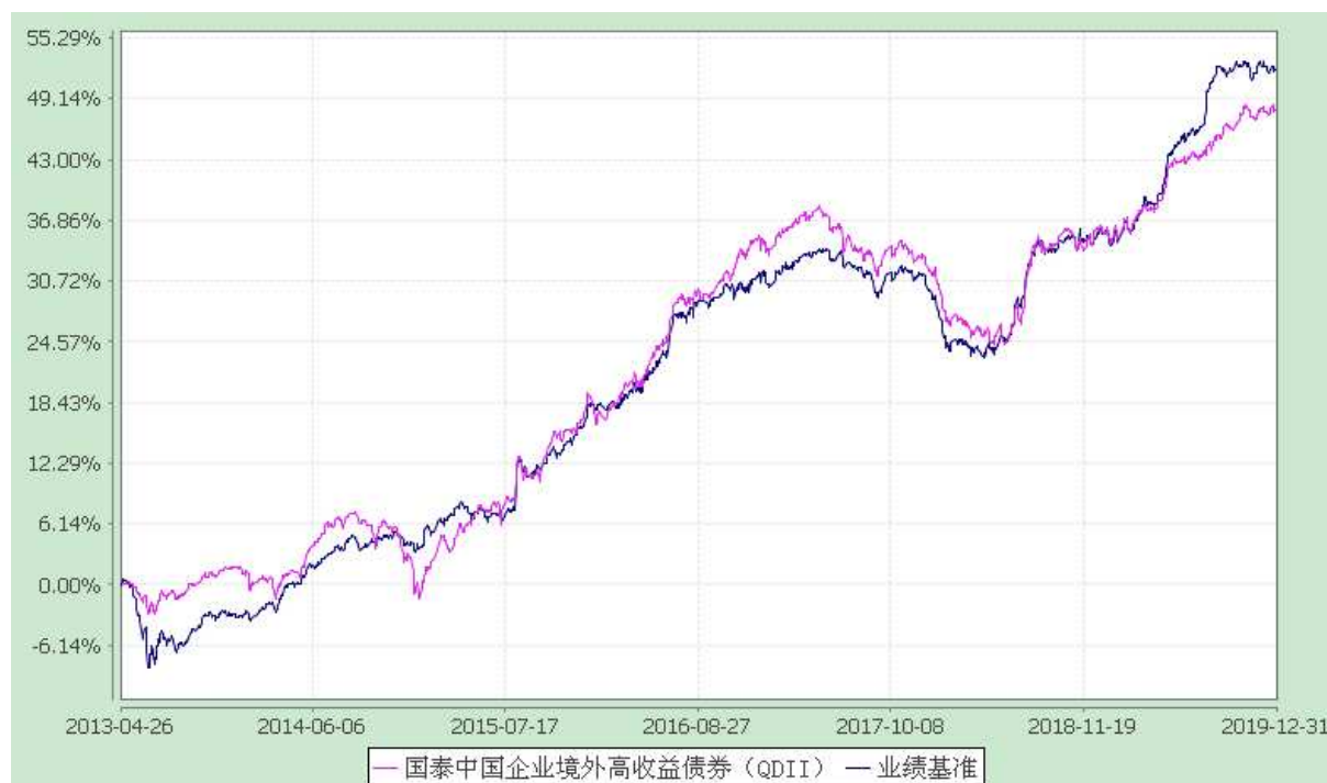
国泰中国企业境外高收益债券型证券投资基金 自基金合同生效以来份额累计净值增长率与业绩比较基准收益率历史走势对比图 (2013 年 4 月 26 日至 2019 年 12 月 31 日)

注：（1）本基金合同生效日为 2013 年 4 月 26 日。本基金在六个月建仓期结束时，各项资产配置比例符合合同约定。