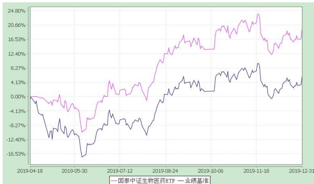
自基金合同生效以来份额累计净值增长率与业绩比较基准收益率的历史走势对比图 (2019 年 4 月 18 日至 2019 年 12 月 31 日)

注：(1)本基金合同生效日为 2019 年 4 月 18 日，截止到 2019 年 12 月 31 日，本基金成立尚未满一年。