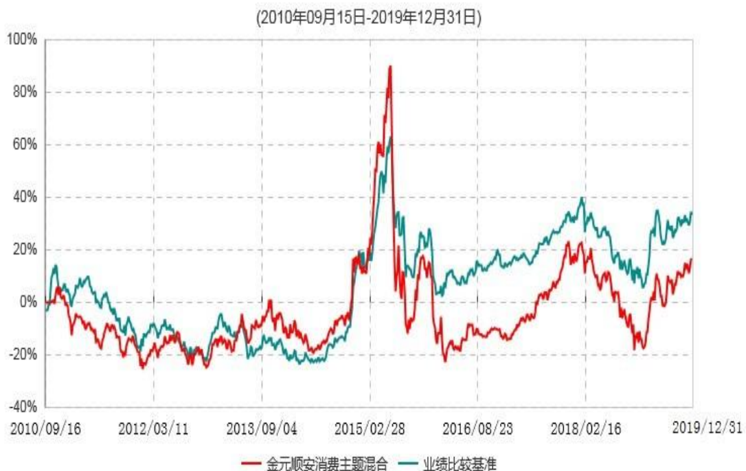
金元顺安消费主题混合型证券投资基金累计净值增长率与业绩比较基准收益率历史走势对比图