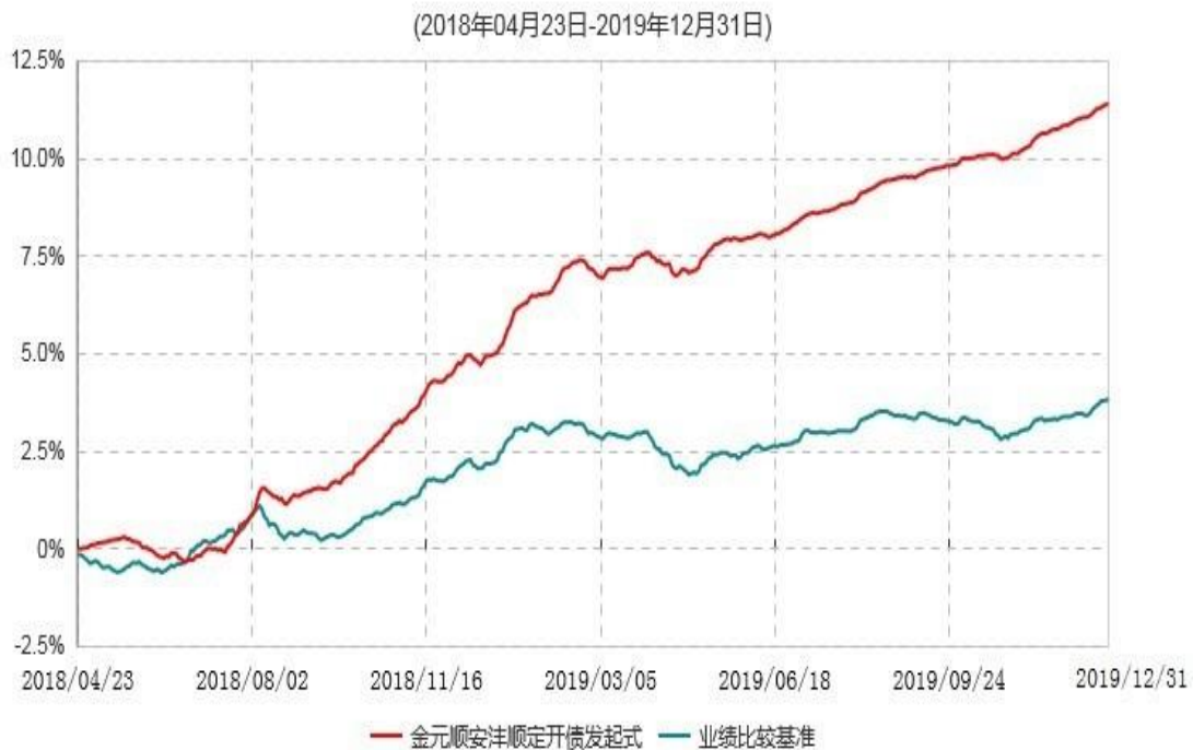
金元顺安洋顺定期开放债券型发起式证券投资基金累计净值增长率与业绩比较基准收益率历史走势对比图