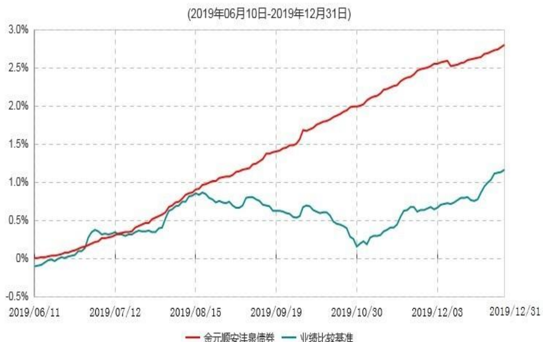
金元顺安沅泉债券型证券投资基金累计净值增长率与业绩比较基准收益率历史走势对比图