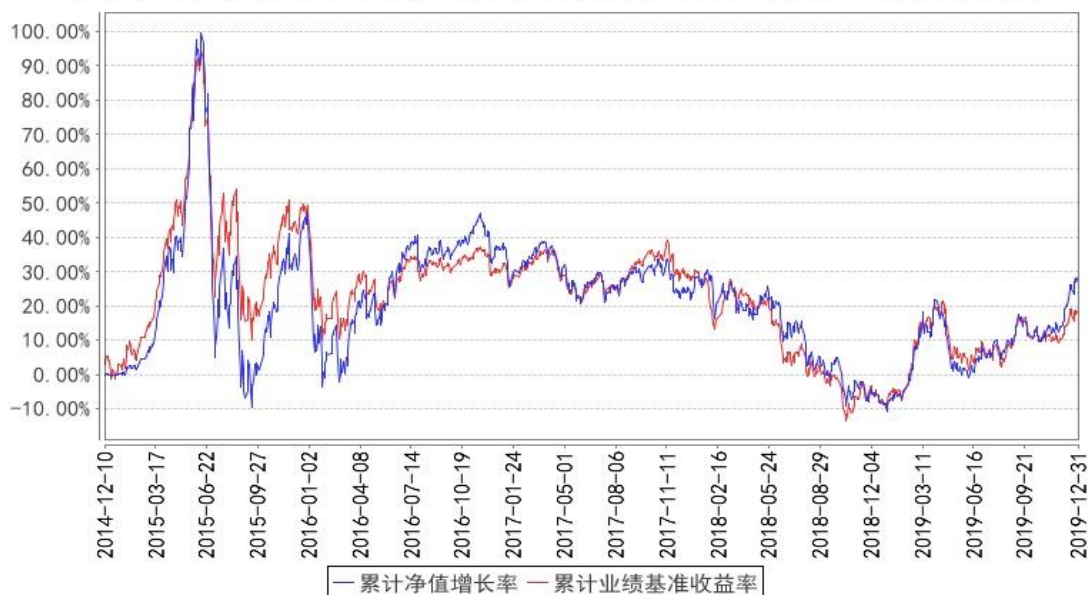
华宝制造股票累计净值增长率与同期业绩比较基准收益率的历史走势对比图

注：按照基金合同的规定，基金管理人当自基金合同生效之日起六个月内使基金的投资组合比例符合基金合同的有关约定。截至 2015 年 6 月 10 日，本基金已达到合同规定的资产配置比例。