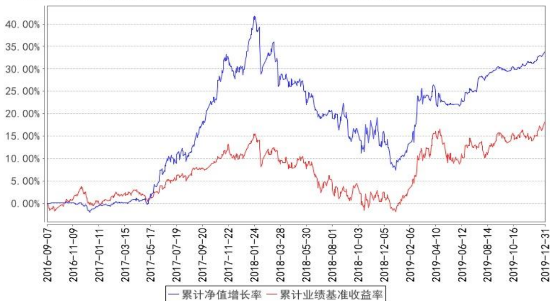
华宝新活力混合累计净值增长率与同期业绩比较基准收益率的历史走势对比图

注:按照基金合同的约定,基金管理人应当自基金合同生效之日起六个月内使基金的投资组合比例符合基金合同的有关约定,截至 2017 年 3 月 7 日,本基金已达到合同规定的资产配置比例。