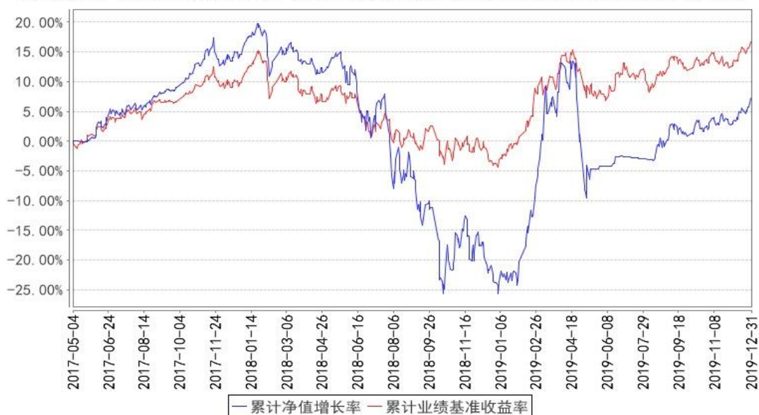
华宝智慧产业混合累计净值增长率与同期业绩比较基准收益率的历史走势对比图

注:按照基金合同的约定,基金管理人应当自基金合同生效之日起六个月内使基金的投资组合比例符合基金合同的有关约定,截至 2017 年 11 月 4 日,本基金已达到合同规定的资产配置比例。