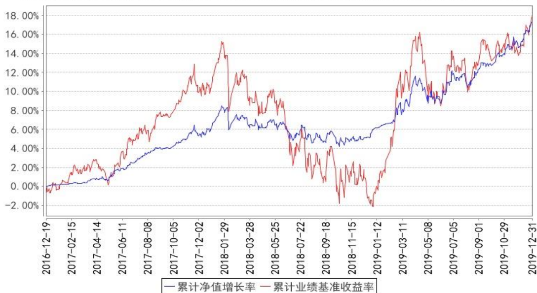
华宝新起点混合累计净值增长率与同期业绩比较基准收益率的历史走势对比图

注:按照基金合同的约定,基金管理人应当自基金合同生效之日起六个月内使基金的投资组合比例符合基金合同的有关约定,截至 2017 年 6 月 19 日,本基金已达到合同规定的资产配置比例。