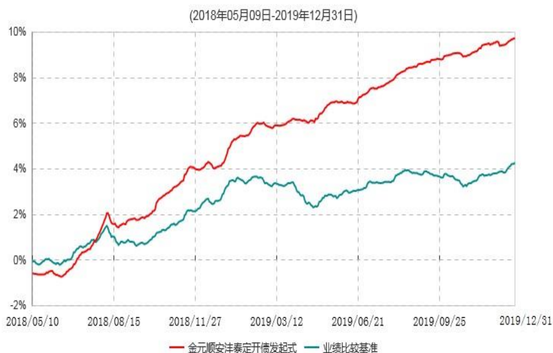
金元顺安沅泰定期开放债券型发起式证券投资基金累计净值增长率与业绩比较基准收益率历史走势对比图