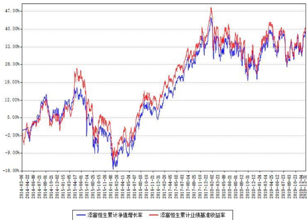
添富恒生累计净值增长率与同期业绩基准收益率对比图

注：本基金建仓期为本《基金合同》生效之日（2014年03月06日）起6个月，建仓期结束时各项资产配置比例符合合同约定。