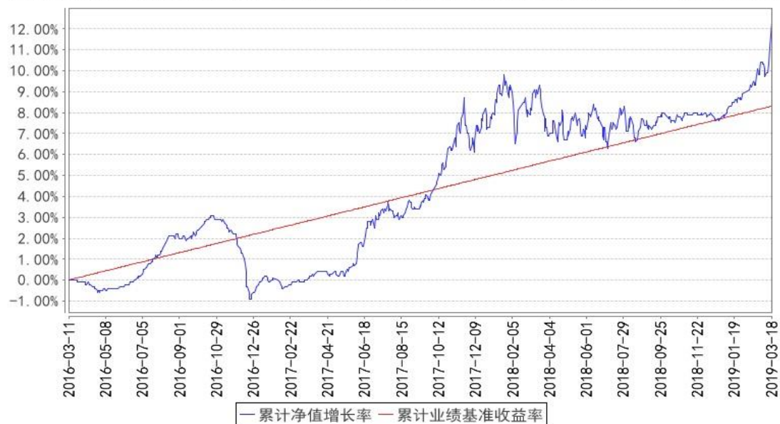
汇添富盈鑫保本混合累计净值增长率与同期业绩比较基准收益率的历史走势对比图

注:本基金建仓期为本《基金合同》生效之日(2016年3月11日起)起6个月,建仓期结束时各项资产配置比例符合合同规定;本基金于2019年03月19日变更注册为汇添富盈鑫灵活配置混合型证券投资基金。