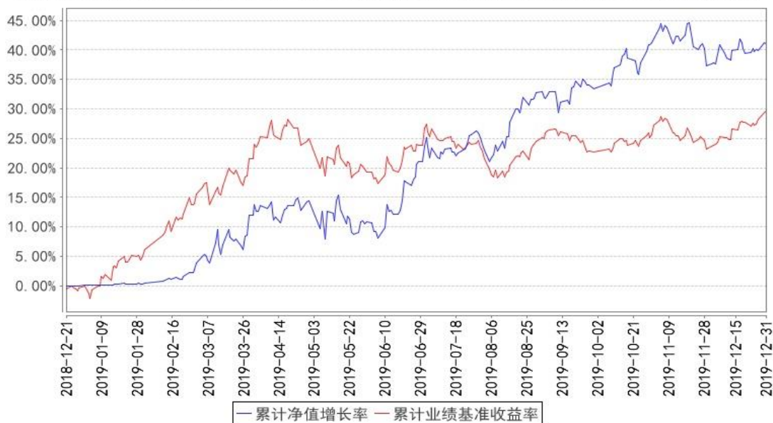
添富消费升级混合累计净值增长率与同期业绩比较基准收益率的历史走势对比图