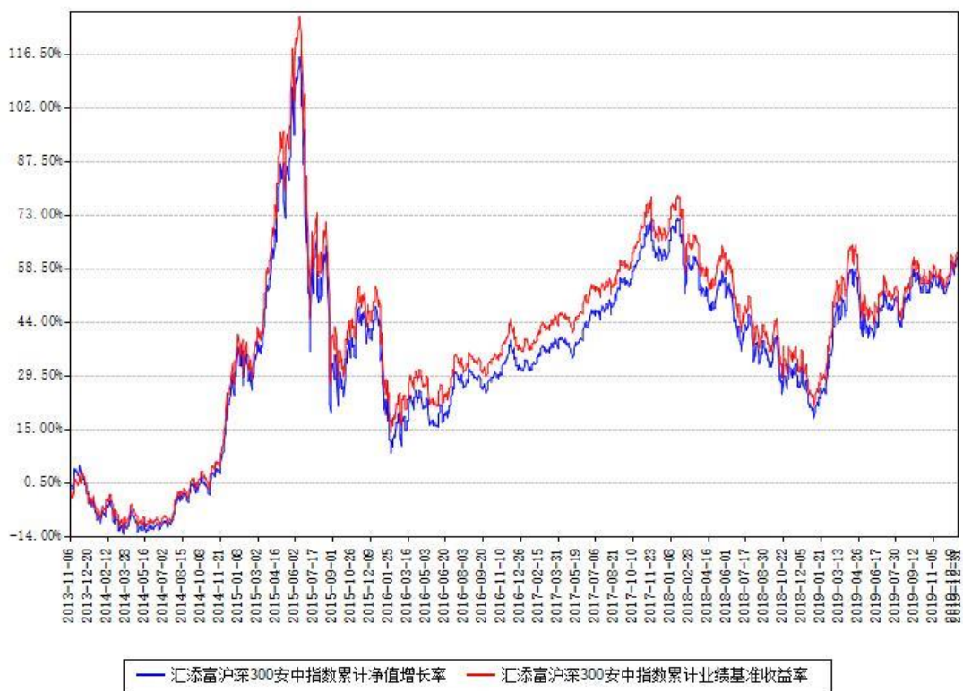
汇添富沪深300安中指数累计净值增长率与同期业绩基准收益率对比图

注：本基金建仓期为本《基金合同》生效之日（2013年11月6日）起6个月，建仓期结束时各项资产配置比例符合合同规定。