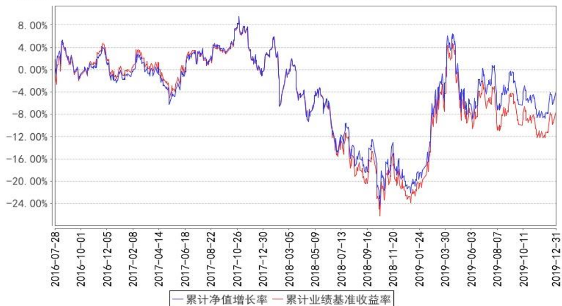
中证上海国企ETF累计净值增长率与同期业绩比较基准收益率的历史走势对比图

注:本基金建仓期为本《基金合同》生效之日(2016年7月28日)起6个月,建仓期结束时各项资产配置比例符合合同规定。