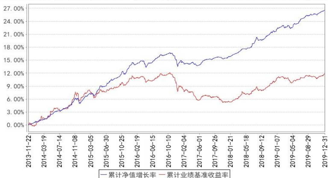
汇添富安心中国债券A累计净值增长率与同期业绩比较基准收益率的历史走势对比图