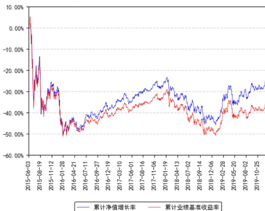
南方中证国有企业改革指数分级累计净值增长率与同期业绩比较基准收益率的历史走势对比图