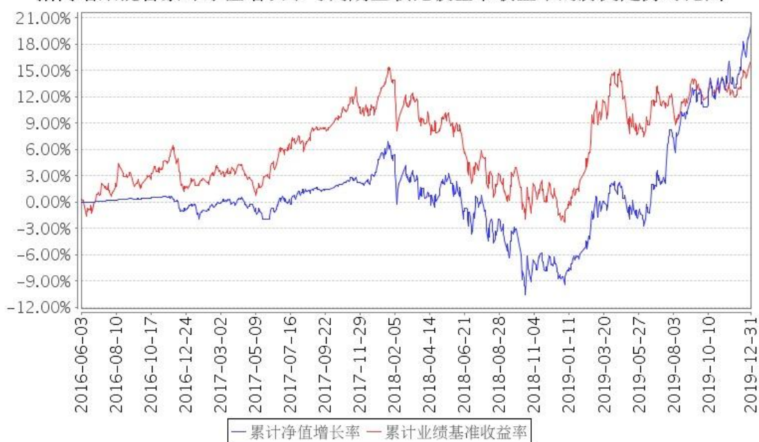
招商增荣混合累计净值增长率与同期业绩比较基准收益率的历史走势对比图