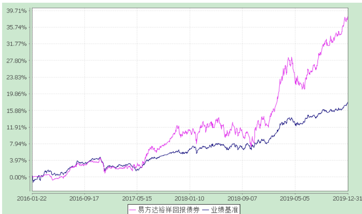
份额累计净值增长率与业绩比较基准收益率历史走势对比图 (2016 年 1 月 22 日至 2019 年 12 月 31 日)

注：自基金合同生效至报告期末，基金份额净值增长率为 38.40%，同期业绩比较基准收益率为 17.85%。