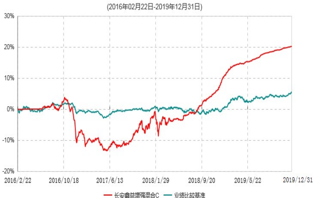
长安鑫益增强混合C累计净值增长率与业绩比较基准收益率历史走势对比图

本基金基金合同生效日为 2016 年 02 月 22 日，基金合同生效日至报告期期末，本基金运作时间超过一年。根据基金合同的规定，自基金合同生效之日起 6 个月内基金各项资产配置比例需符合基金合同要求。本基金在建仓期结束后，各项资产配置比例已符合基金合同有关投资比例的约定。图示日期为 2016 年 02 月 22 日至 2019 年 12 月 31 日。