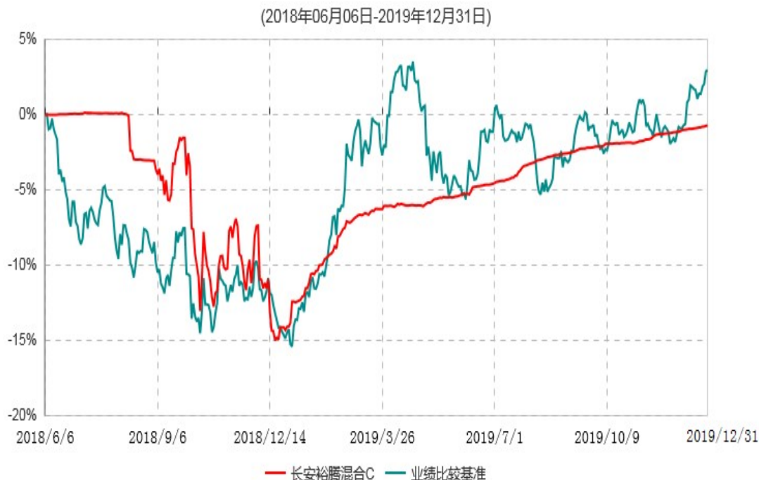
长安裕腾混合C累计净值增长率与业绩比较基准收益率历史走势对比图

根据基金合同的规定,自基金合同生效之日起6个月内基金各项资产配置比例需符合基金合同要求。本基金在建仓期结束后,各项资产配置比例已符合基金合同有关投资比例的约定。基金合同生效日至报告期末,本基金运作时间已满一年。图示日期为2018年06月06日至2019年12月31日。