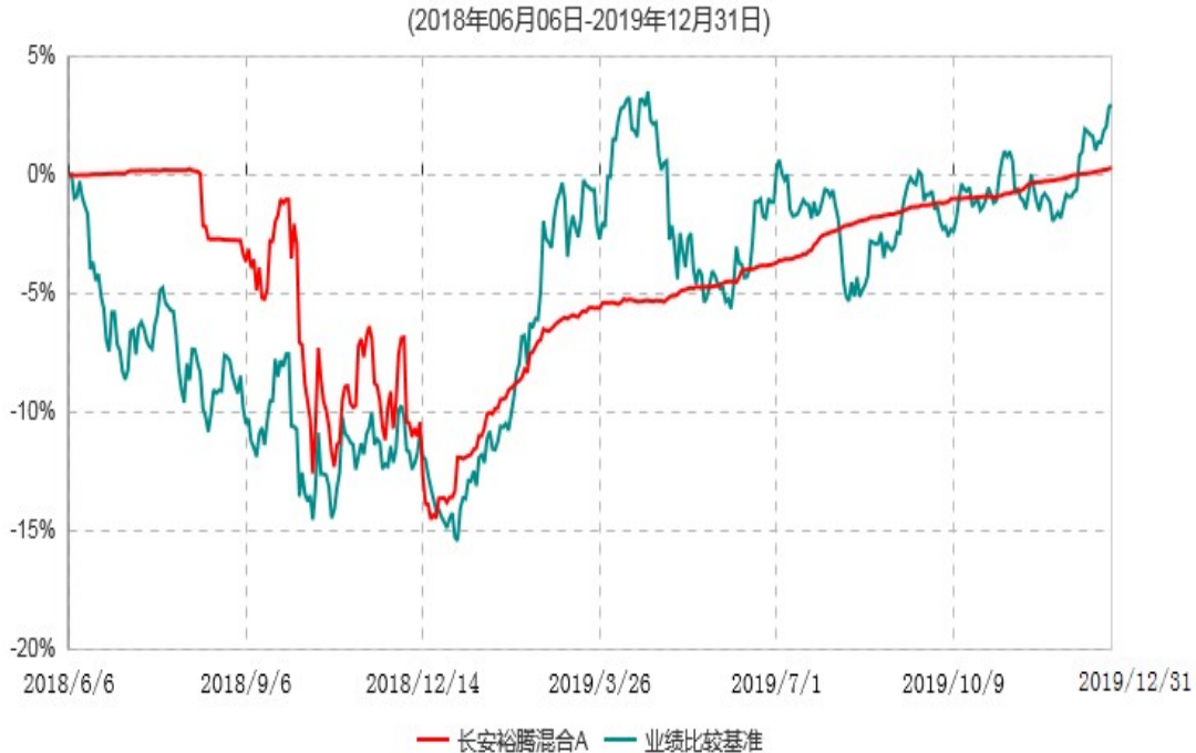
长安裕腾混合A累计净值增长率与业绩比较基准收益率历史走势对比图

根据基金合同的规定,自基金合同生效之日起 6 个月内基金各项资产配置比例需符合基金合同要求。本基金在建仓期结束后,各项资产配置比例已符合基金合同有关投资比例的约定。基金合同生效日至报告期末,本基金运作时间已满一年。图示日期为 2018 年 06 月 06 日至 2019 年 12 月 31 日。