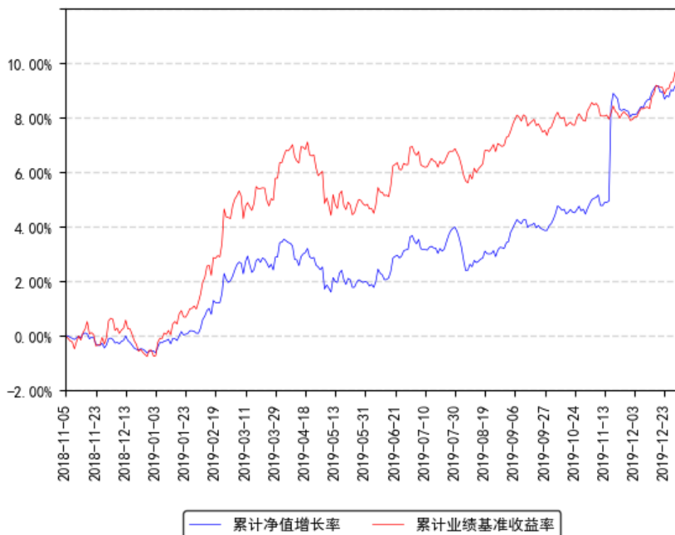
南方固胜定期开放混合累计净值增长率与同期业绩比较基准收益率的历史走势对比图