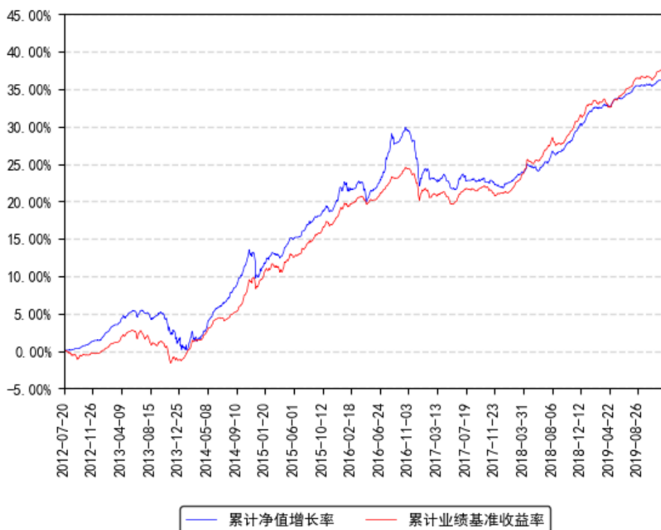
南方润元纯债A/B类累计净值增长率与同期业绩比较基准收益率的历史走势对比图